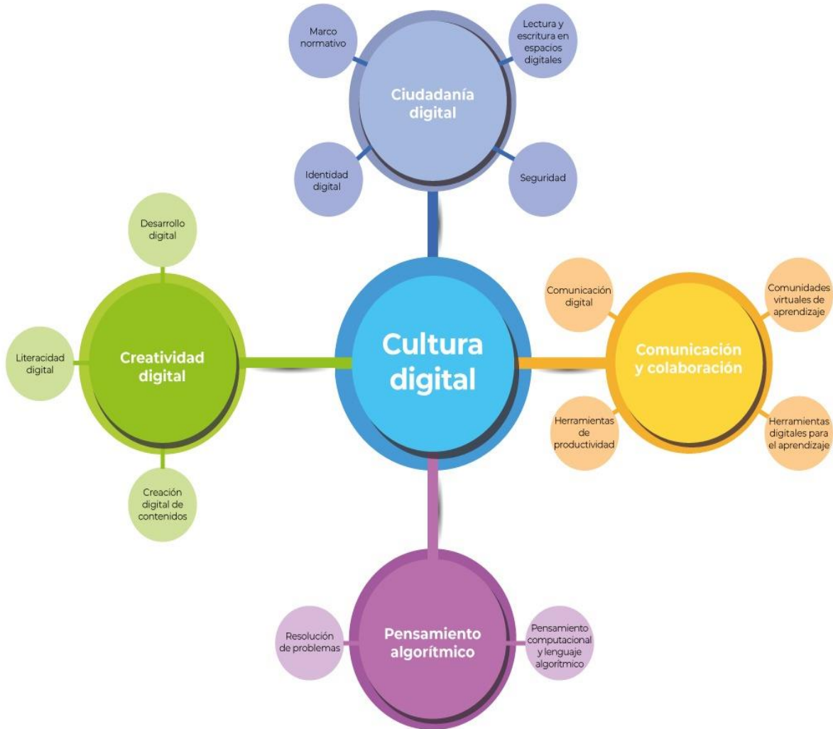
Figura 1. Categorías y subcategorías de Cultura digital