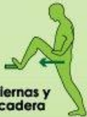
Piernas y cadera