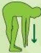
Cintilla iliotibial e isquiotibiales