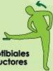
Isquiotibiales y aductores